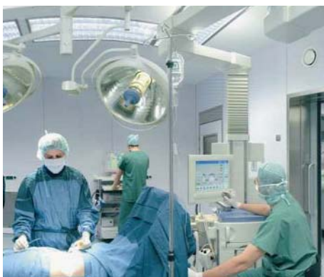
Abb. 2: Überwachung während der Anästhesie

Eine besondere Herausforderung stellt der Bau eines Sensors dar, mit dem ein Nachweis des intravenös verabreichten Narkosemittels Propofol im Konzentrationsbereich von 1-20 ppb in der Atemluft des Patienten während einer Operation erfolgen kann. Die Aufgabenstellung besteht darin, ein Membran-Elektroden-System anzubieten, mit dem das Propofol mit der geforderten Nachweisgrenze in der Atemluft bestimmt werden kann.