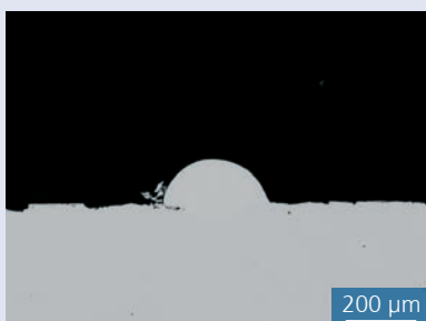
Querschnitt einer Einzelspur mit 0,1 mm Drahtdurchmesser und 100 W Laserleistung.