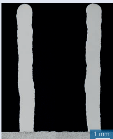
Mikro-Wandstrukturen-Querschnitte aus 28 Lagen mit 0,4 mm Draht- und 1 mm defokussiertem Laserstrahl-Durchmesser.